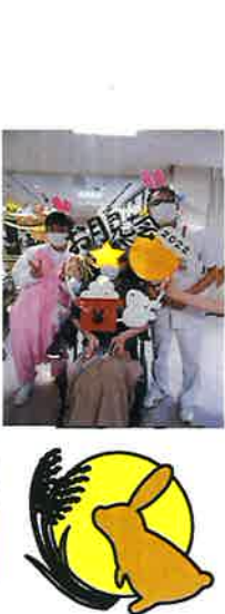
ソフトクリームを 食べる会