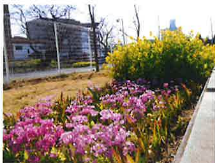
「園芸ボランティアによる花壇」

また今回は、地域のボランティア情報などを皆さんで共有することもでき、とても有意義な会となりました。