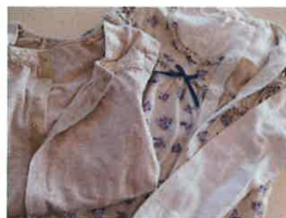
「裁縫ボランティアさんによって加工されたミトンと洋服」