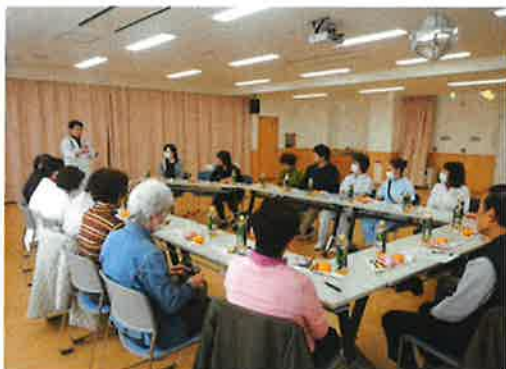
「ボランティア懇談会の様子」

重症心身障害病棟では、いろいろな場面でボランティアさんに活動していただいています。今回は裁縫・入浴・園芸・車いす清掃のボランティアさん7名、重症心身障害病棟保護者会4名、職員10名が参加し和やかに話をする事ができました。