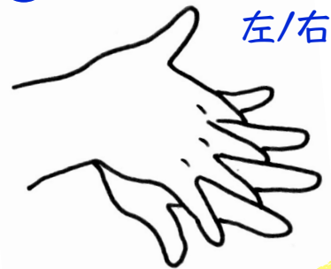
手の甲と指の間に広げる