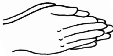
手のひらに すり込む