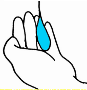
手指消毒剤を手にとる