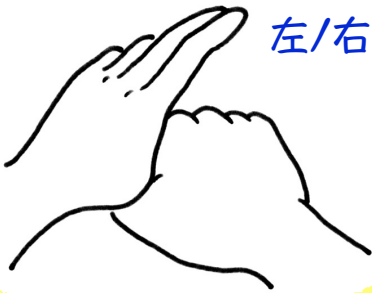
親指を包み ねじってこする