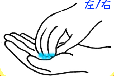
つめを消毒剤に漬けてこする