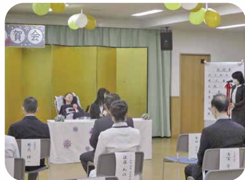
たくさんの方に祝辞を頂きました。