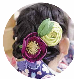
素晴らしい晴れ姿です。