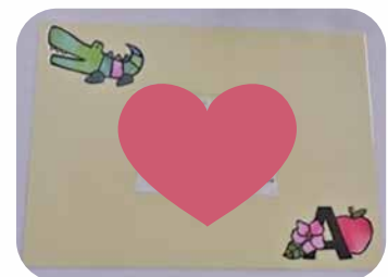
▲切り絵で保育士がフォトフレームを作りました！