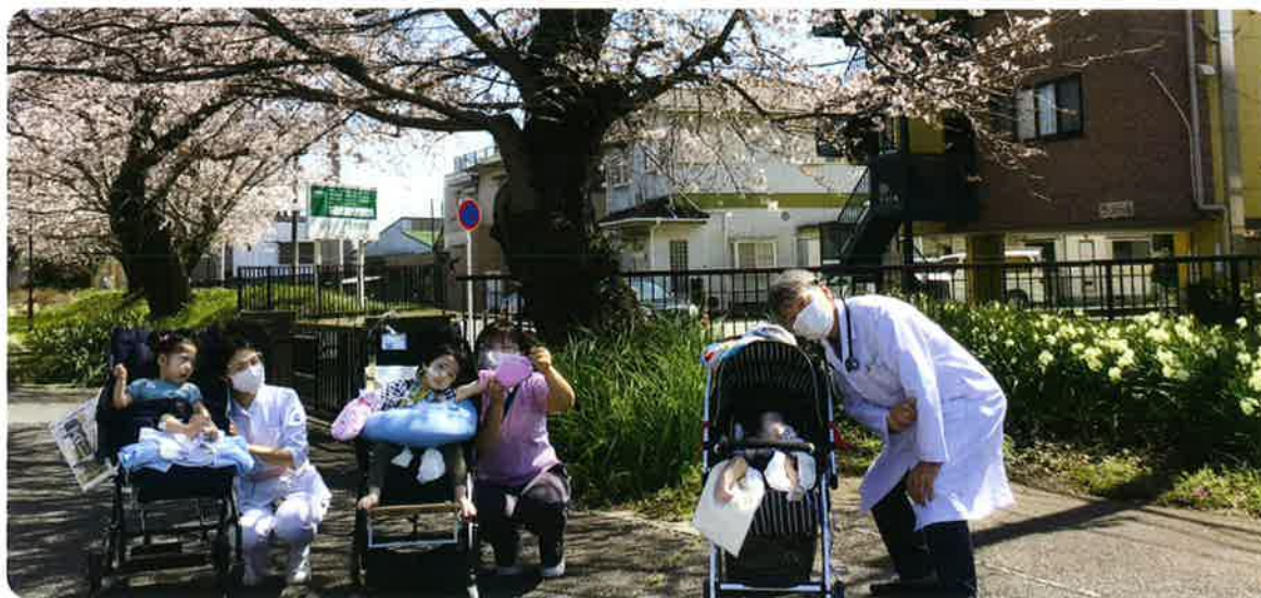
春の風を感じる散歩

これからもご家族と一緒に、患児の成長をサポートできるよう、スタッフ一同頑張っていきます。