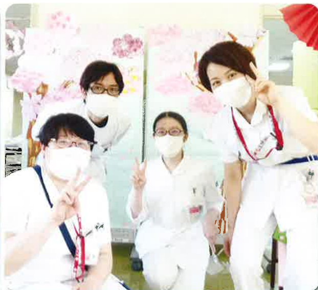
筋ジストロフィー看護分野 4名