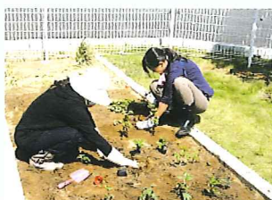
<園芸ボランティア>

ここでは当院のボランティア活動の様子の一部をご紹介します。当院のボランティアさんは黄色いエプロンが目印です。