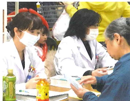
★栄養・お薬相談コーナー 食事のバランスやお薬の服用等について、健康意識の高い方々から様々な相談がありました