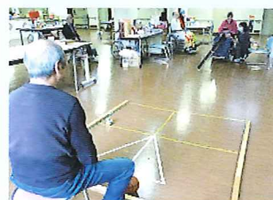
<余暇・グループ活動>