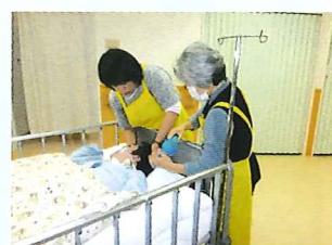
<入浴ボランティア>