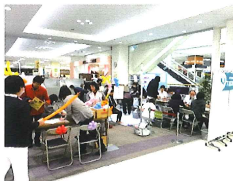
★クイズコーナー 答え合わせをしながら、「楽しくイベントに参加できました」と嬉しい声をいただきました