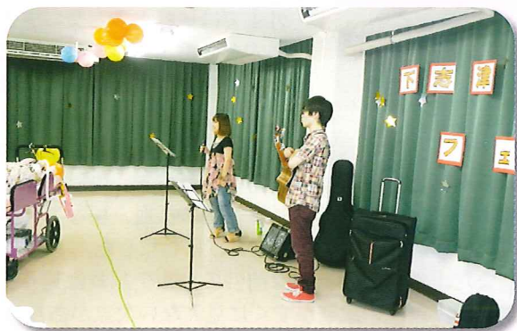
ライブ出演アーティスト 「Mean's」