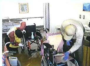
<車椅子清掃ボランティア>