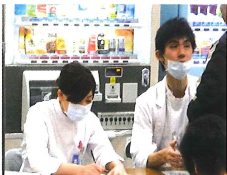
★握力測定コーナー 「日頃、測定することがなく、自分の握力が判った」とお礼の言葉もありました