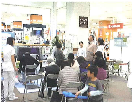
★体脂肪・骨密度測定コーナー 人気のコーナーで、たくさんの方々が参加者されました

また、秋祭りの実施には、医局を始め、看護部、薬剤科、臨床検査科、放射線科、栄養管理室、リハビリテーション科、療育指導室、事務部の各職場から応援していただき、それぞれのコーナーで活躍していただきました。