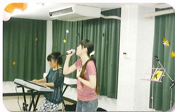
ライブ出演アーティスト 「cloth」