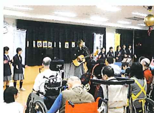
<ロビーコンサート>