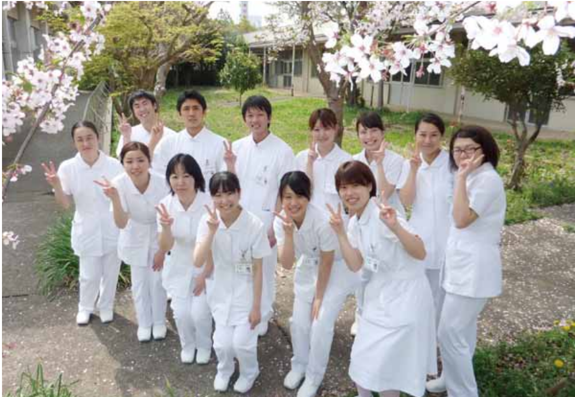
平成24年度新人看護師