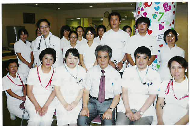
筋ジストロフィー病棟スタッフ

神経内科では末梢神経や脳、脊髄などの神経系と筋肉の病気を診療します。末梢神経は血管やリンパ管と同様に、身体の隅々に枝分かれしながら分布して、手足の筋肉を動かしたり、目や耳、手足からの感覚を伝えます。これらはその働きにより運動神経、感覚神経と呼ばれます。また緊張すると手に汗を握り脈が速くなりますが、これは自律神経の働きです。大脳や小脳はこれらの機能を統合し、文字や音声を理解して言葉を話すなどの高次機能を担っています。このように私たちが外界を認識したり、外界に働きかけをする際には必ず神経が介在していますから、神経の病気により生ずる症状は多彩です。また脳に病気があっても、そこから出た神経が分布する場所に異常が現れますから、身体のあちこちに症状が出現します。手がしびれるからといって手が悪いのではなく、首や頭に病気がある場合もありますし、「身体がふらついて手がうまく動かせず言葉がもつれ、排尿や排便がしづらく立ちくらみがする」といった一見脈絡のなさそうな症状が組み合わさる病気すらあるのです。その意味で神経疾患の症状は、整形外科や眼科、耳鼻科、泌尿器科など他の診療科の病気の症状とオーバーラップします。物が二重に見えたり、耳鳴りやめまいがする、身体の動きがどこか普段と違うなどで医師の診察を受けただけで異常がみつからない場合には、神経の病気の可能性がないか相談なさることをお勧めします。