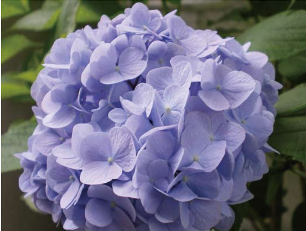
「あじさい」