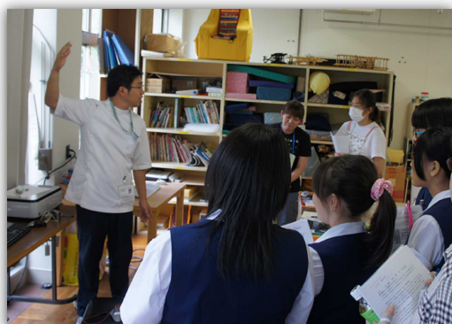
リハビリテーション科

また、「医療の仕事に興味をもった」、「将来の夢につなげたい」との声もあり、学生が将来の進路を考えるきっかけにもなっており、毎年好評いただいています。