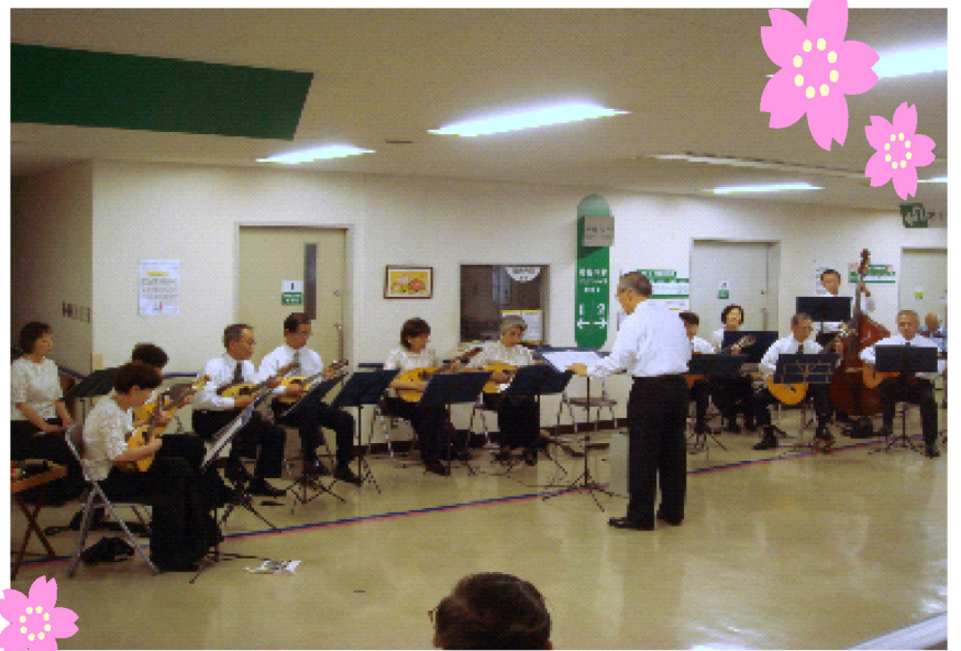
マンドリンアンサンブル・トレモロ 様

マンドリン・トレモロ様は、マンドリンを中心にオリジナル編曲した曲を、老人ホーム、病院、福祉施設等で演奏を行っているグループです。当院では平成9年より、年1回のロビーコンサートや、病院行事でも演奏していただいております。当院でロビーコンサートを初めて行ったグループでもあります。平成18年からは、定期のロビーコンサートへその活動を移していただき、ロビーコンサートには無くてはならないグループとなっております。