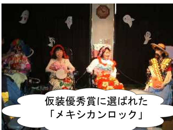
仮装優秀賞に選ばれた「メキシカンロック」