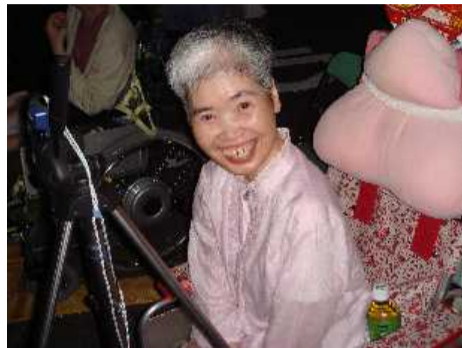
笑顔も花火も最高です