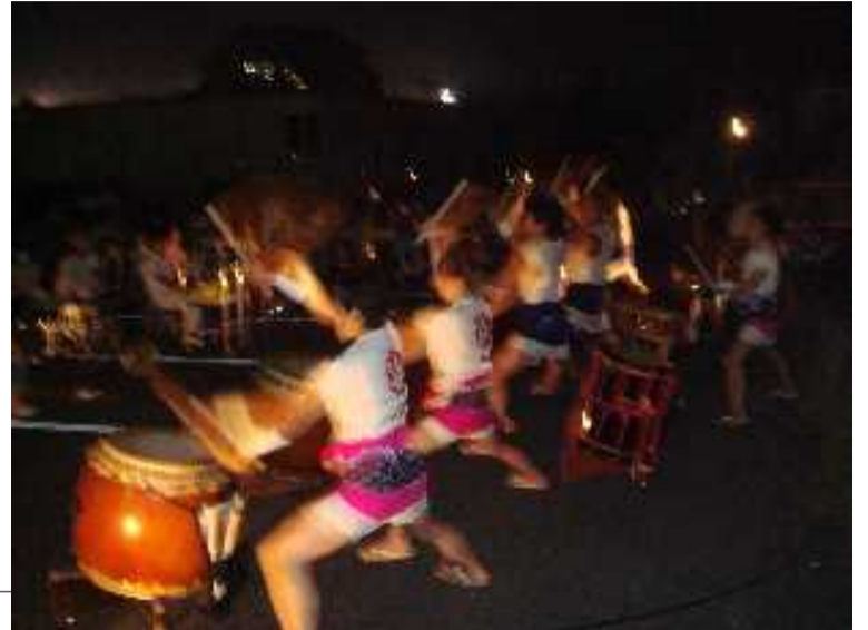
迫力満点の三笠会の太鼓演奏