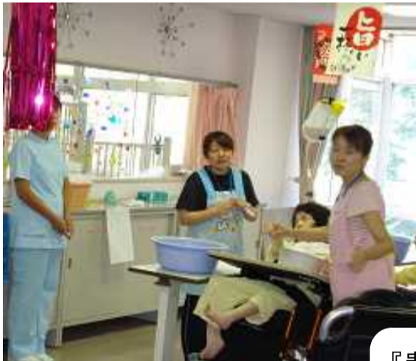
<重症心身障害児者病棟>

『患者さんや職員が明るく楽しそうだった。いろいろな人と関わることができて楽しかった。』