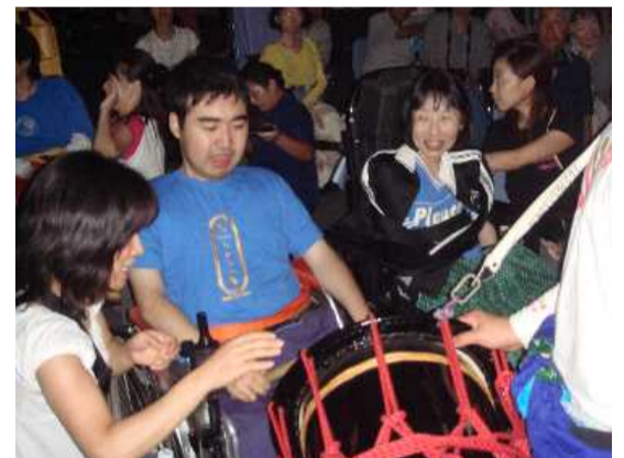
近くで太鼓を叩かせてくれました

「きれいだったね」「楽しかったね」などなど花火見学会終了後みんなと交わした会話です。後日患者さんが撮った花火の写真もたくさんみせてもらいました。8月21日の花火見学会。多くの患者さんが夜同時に野外へ出る。呼吸器は大丈夫？吸引は？狭い場所でトラブルはないか？等など、開始前まで不安と心配がありました。しかし、ひしめきあう状況の中、患者さん、呼吸器、車いすとも整然と移動し、花火見学から病棟まで心配していたトラブルも無く看護師として参加した私の出番はほとんどありませんでした。痰の多い患者さんもゼロゼロすることなく、元気のなかった患者さんもみんなとてもよい表情で歓声をあげていました。行事にはマンパワーの大切さを感じます。今回も多くのボランティアさんが参加してくださり、家族のみなさんと同じように移動時だけでなく、花火の間もうちわで扇いだり、患者さんに話しかけたり、たくさんの笑顔や会話がありました。細かい気配りをありがとうございました。ボランティアさんの協力ですべて楽しんだ花火見学会。この企画がこれからも続くことを願っています。