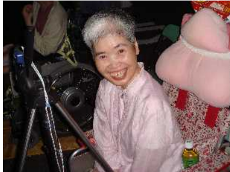
笑顔も花火も最高です