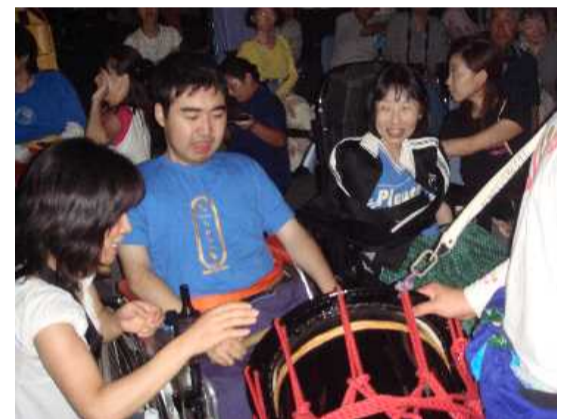
近くで太鼓を叩かせてくれました

行事にはマンパワーの大切さを感じます。今回も多くのボランティアさんが参加してくださり、家族のみなさんと同じように移動時だけでなく、花火の間もうちわで扇いだり、患者さんに話しかけたり、たくさんの笑顔や会話がありました。細かい気配りをありがとうございました。ボランティアさんの協力ですべて楽しんで花火見学会。この企画がこれからも続くことを願っています。