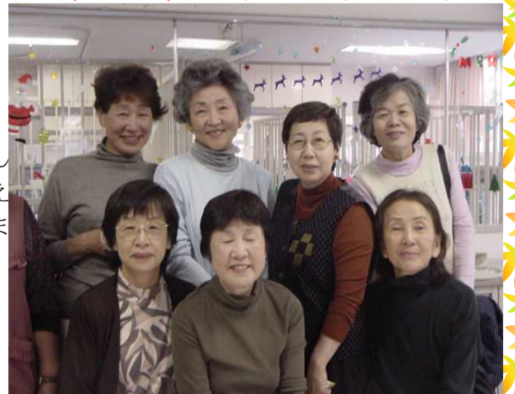
下志津病院ボランティア委員会発行