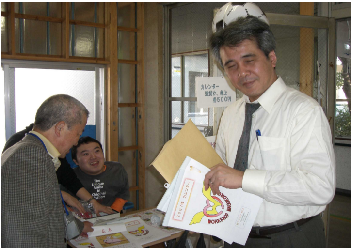
お買いあげありがとうございます！

*（袋物の製作には、他の社協ボランティアグループから多大なご支援を頂いており、この場を借りてお礼申し上げます。