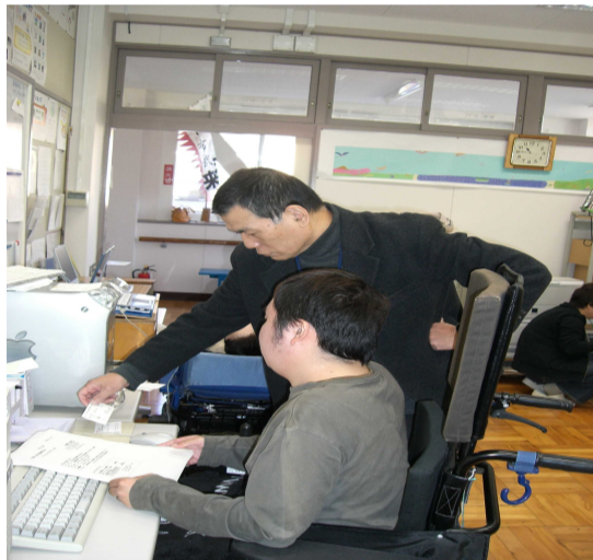
工房での作業風景