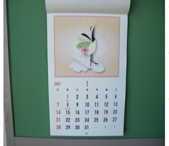
全てオリジナルデザインです！