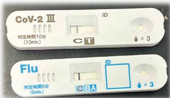
上：SARS-Cov.19の抗原定性キット（陰性） 下：インフルエンザA,Bの抗原定性キット（陰性）

臨床検査科では、これからも「正確・迅速・安全な検査」を通じて、皆さまの診療と安心を支えてまいります。